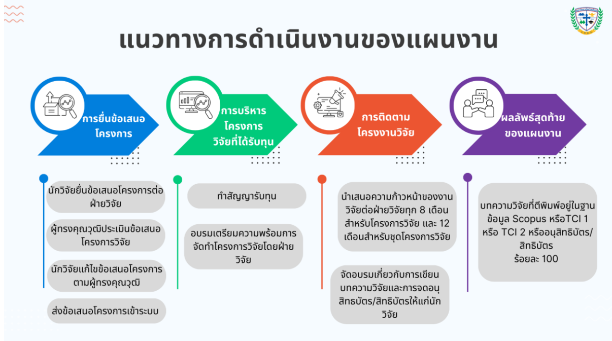
รูปที่ 3 แนวทางการดำเนินงานของแผนงานในปีงบประมาณ 2567-2570