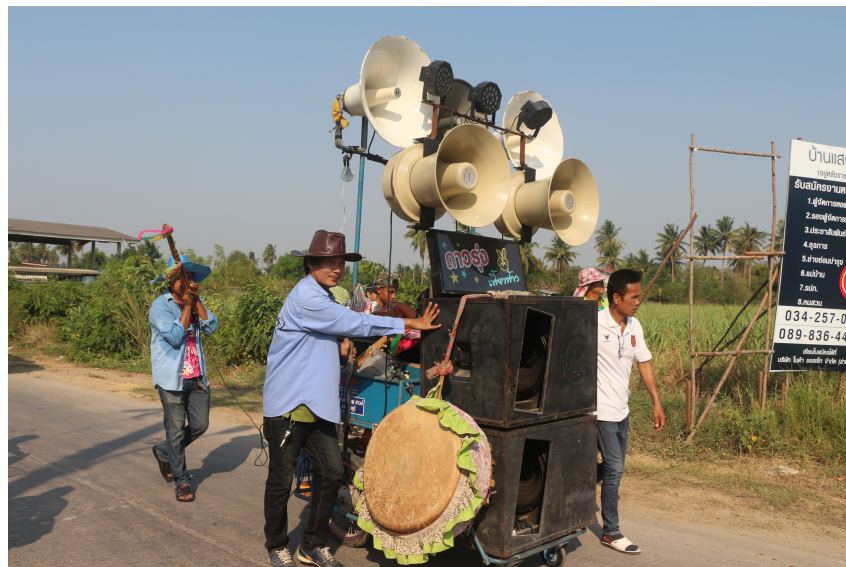
ภาพที่ 4 ภาพอุปกรณ์ต่างๆที่ใช้ในการแสดง

อนึ่ง อุปกรณ์ประกอบการแสดงนี้ แต่ละคณะมีการเลือกใช้และประยุกต์รูปแบบแตกต่างกันไป ขึ้นอยู่กับความพร้อมของแต่ละคณะ