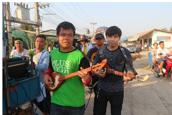
ภาพที่ 8 ภาพเยาวชนรุ่นใหม่มาร่วมฝึกทักษะการบรรเลงพิณกับวงพัฒนาแคน