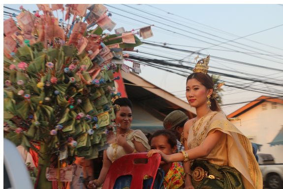
ภาพที่ 6 ภาพกองผ้าป่าสามัคคี

วงดนตรีพื้นบ้านพินแคนประยุกต์ฯ มีลักษณะการแสดงบรรเลงเพลงที่ให้ความสนุกสนาน ครื้นเครง รื่นเริง เ้าใจ ดังนั้นผู้คนทั่วไปจึงนิยมว่าจ้างวงพินแคนประยุกต์ฯ ไปแสดงในงานที่เป็นงานมงคล หรืองานที่มีความยินดีต่างๆ เช่น งานบวช งานขึ้นบ้านใหม่ งานเจ้า งานแห่ขันหมาก งานแห่กฐินผ้าป่า งานฉลองต่างๆ ฯ สำหรับงานที่เป็นอวมงคลผู้คนทั่วไปไม่นิยมนำไปแสดง