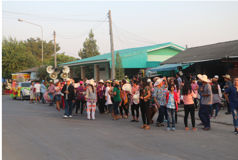
ภาพที่ 7 ภาพวงพิณแคนฯ แห่งขบวนกองผ้าป่าสามัคคี