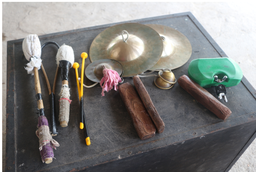
ภาพที่ 3 ภาพเครื่องประกอบจังหวะ