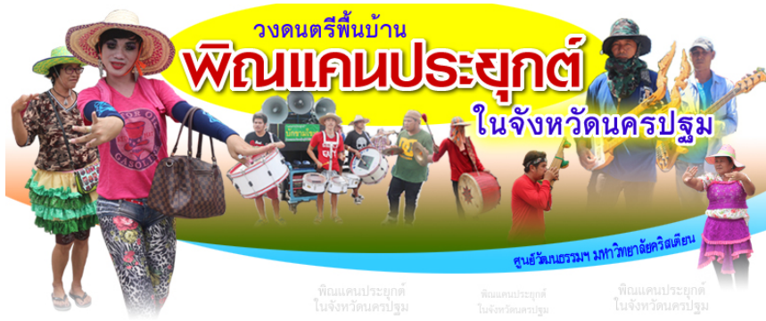
พืฒแคนประยุกต์ ในจังหวัดนครปฐม