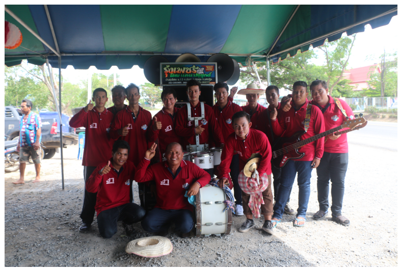
ภาพที่ 1 ภาพแสดงจำนวนสมาชิกนักแสดงวงพิณแคนฯ

ในการแสดงแต่ละครั้งจะมีสมาชิกจำนวนนักแสดงจำนวนอยู่ที่ประมาณ 10 – 18 คน หรือมากกว่านี้ ทั้งนี้ขึ้นอยู่กับลักษณะของงาน กล่าวคือ การแสดงในแต่ละครั้งเจ้าภาพจะมีความต้องการเครื่องดนตรีที่ต่างกัน เจ้าภาพบางงานต้องการเครื่องดนตรีหลักคือพิณกับแคน ก็จะใช้ นักดนตรีประมาณ 10-12 คน แต่ถ้าเจ้าภาพต้องการให้มีกลองยาวผสมกับพิณแคน หรือต้องการให้มี เครื่องดนตรีอื่นๆ ผสมด้วย ก็จะมีนักดนตรีเพิ่มขึ้นตามเครื่องดนตรี