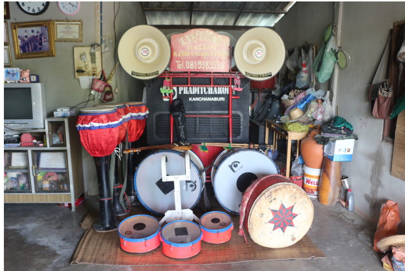
ภาพที่ 2 ภาพเครื่องดนตรีวงพืฒแคนประยุกต์